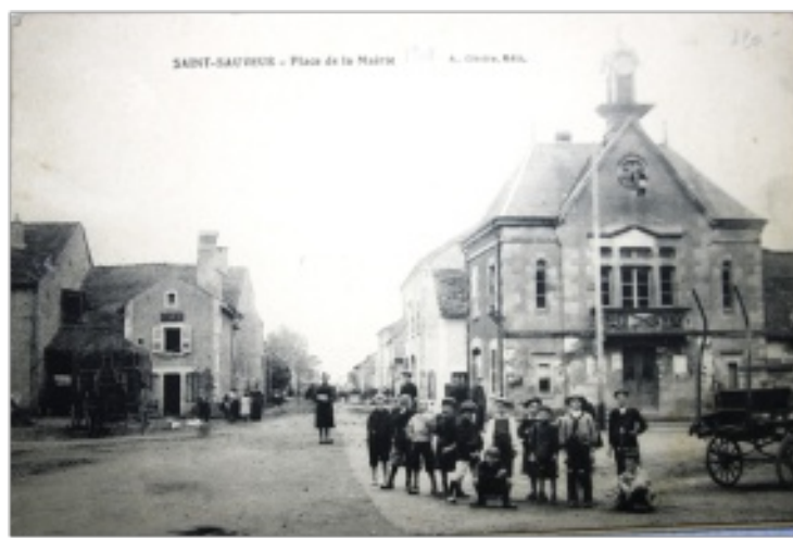
La place avant 1905