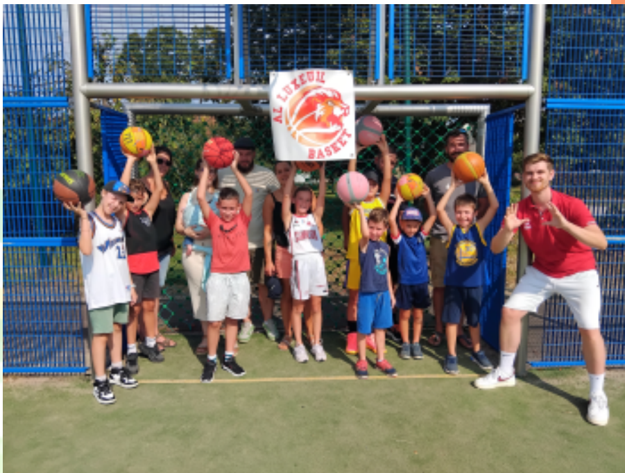
Amicale Laïque Saint-Sauveur/Luxeuil Tél.07.66.26.70.38