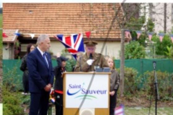
Commémoration de la libération de Saint-Sauveur