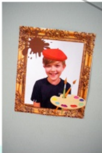
Exposition travaux enfants des écoles