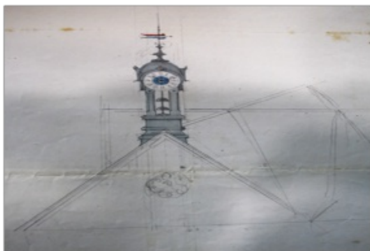
Projet de campanile et de l'horloge

Nous n'avons pas trouvé non plus la date d'inauguration de ces nouveaux locaux, mais la mairie a continué à payer un loyer pour sa salle municipale jusqu'en 1872.