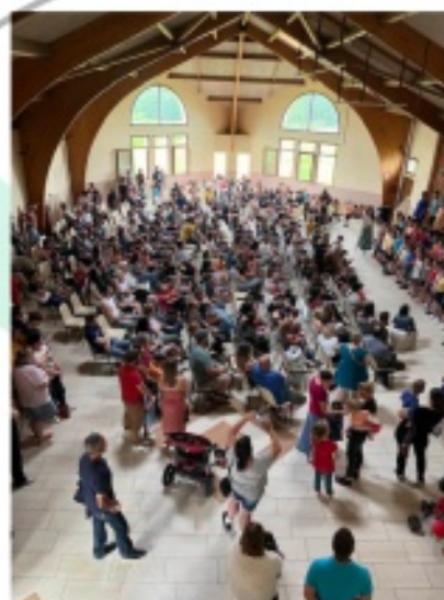
Spectacle de chant des écoles