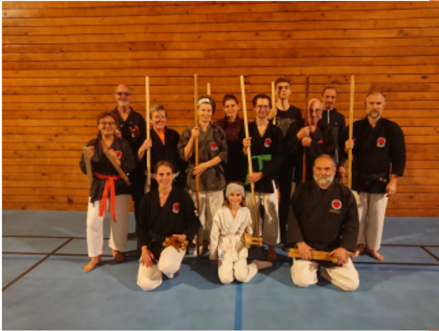
Okinawa te traditionnel Armes d'Okinawa Tél.06.83.32.74.02