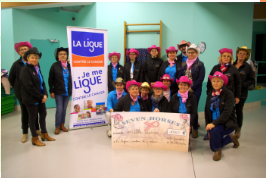
Seven Horses Country Club Tél.06.38.30.47.62