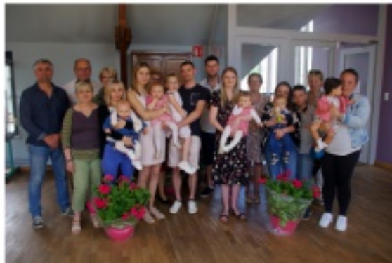
Fête des mères