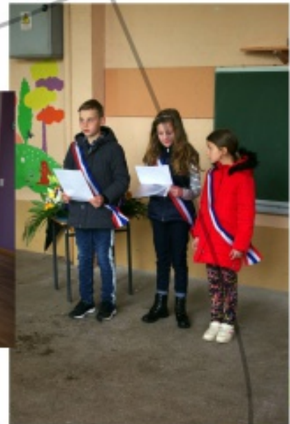
Journée des déportés