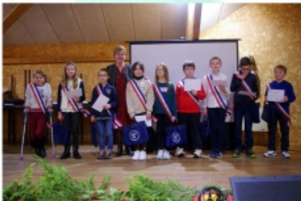
Cérémonie des voeux avec remise des écharpes au Conseil Municipal des Jeunes