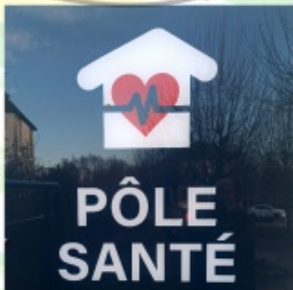
Installation de praticiens dans la maison médicale