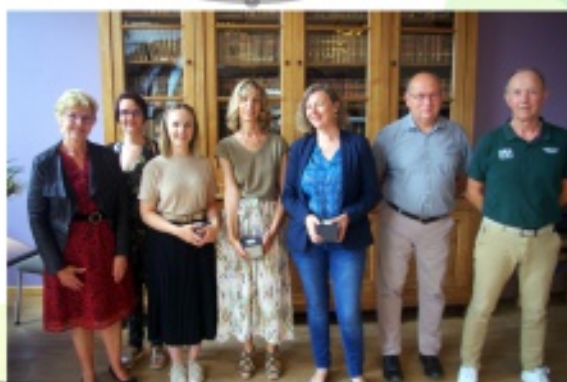
Départ de la directrice de l'école