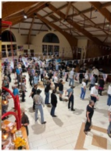
Festival de Country