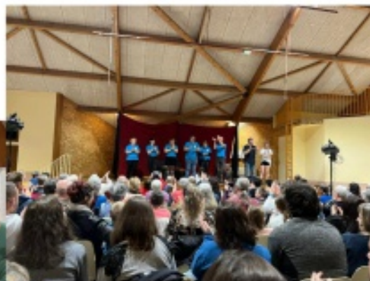
Pièce de théâtre