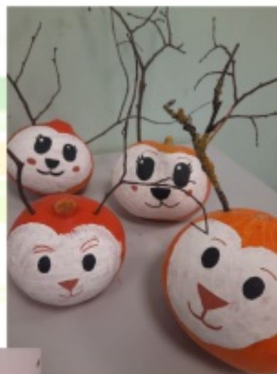
Fête de la citrouille