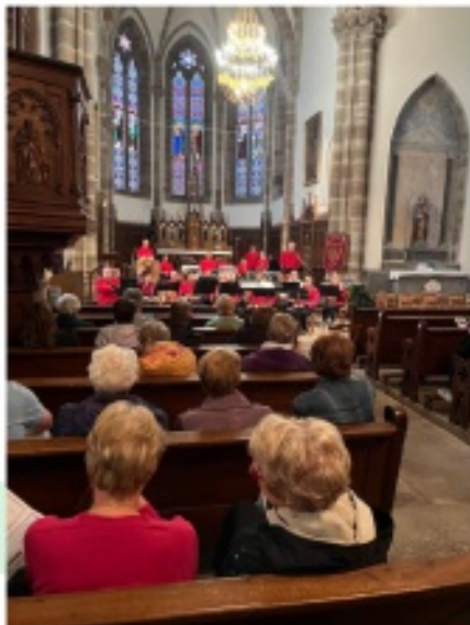
Concert Harmonie de Fougerolles