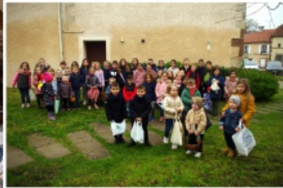
Chasse aux oeufs