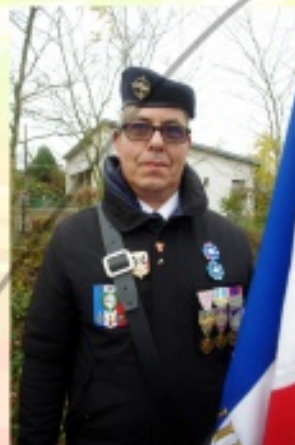
Remise de l'insigne de porte-drapeau