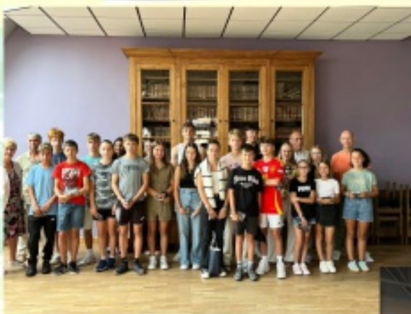
Remise des cartes avantages jeunes