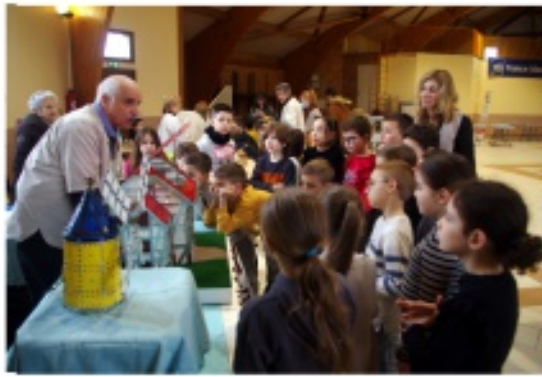
Du grain au pain